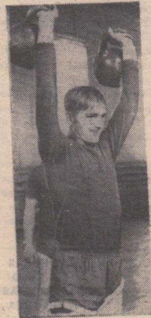
На снимке: в спортивном зале Шеломковского училища механизации.

Из Москвы: 20.30—М. Алексеев. Отрывок из романа «Ивушка неплачущая». Читает автор. 20.40 — Музыкальные встречи. 21.20 — А. Штейн. «Вдовец». Спектакль Московского академического художественного театра.